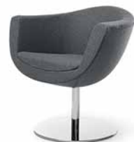
SORRISO 10R CHROM