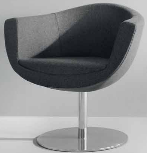
SORRISO 10R CHROM