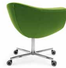
SORRISO 10F CHROM KÓŁKA