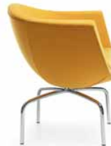
SORRISO 10HS CHROM