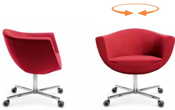
SORRISO 10F CHROM KÓŁKA