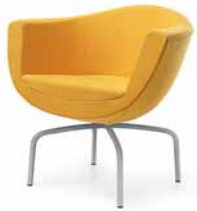
SORRISO 10HS METALIK