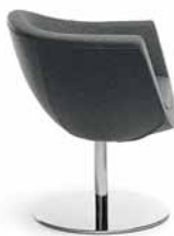
SORRISO 10R CHROM