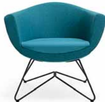
SORRISO 10V CZARNY