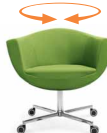
SORRISO 10F CHROM KÓŁKA