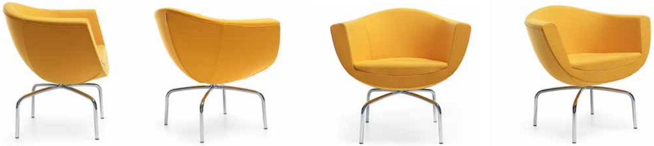
SORRISO 10HS CHROM