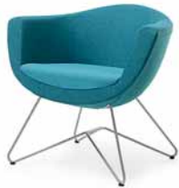
SORRISO 10V METALIK