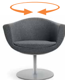
SORRISO 10R METALIK