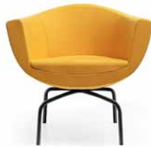
SORRISO 10HS CZARNY