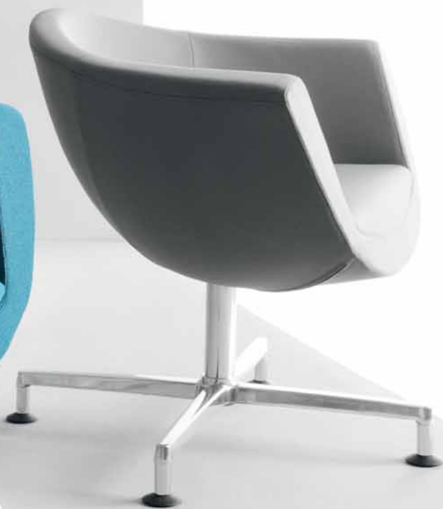
SORRISO 10F CHROM STOPKI