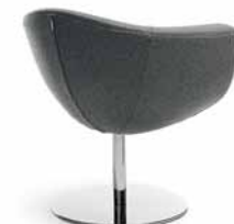
SORRISO 10R CHROM