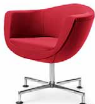
SORRISO 10F CHROM STOPKI