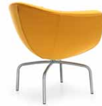
SORRISO 10HS SATYNA