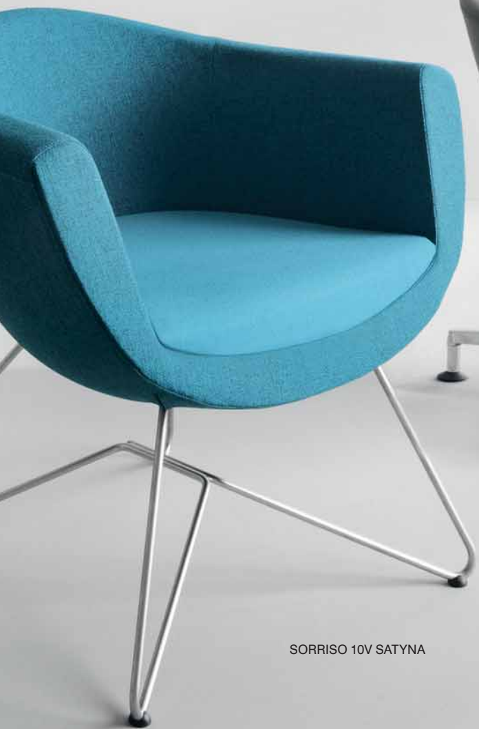
SORRISO 10V SATYNA