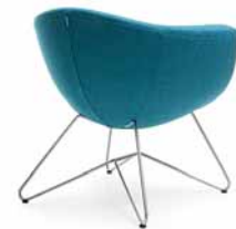
SORRISO 10V SATYNA