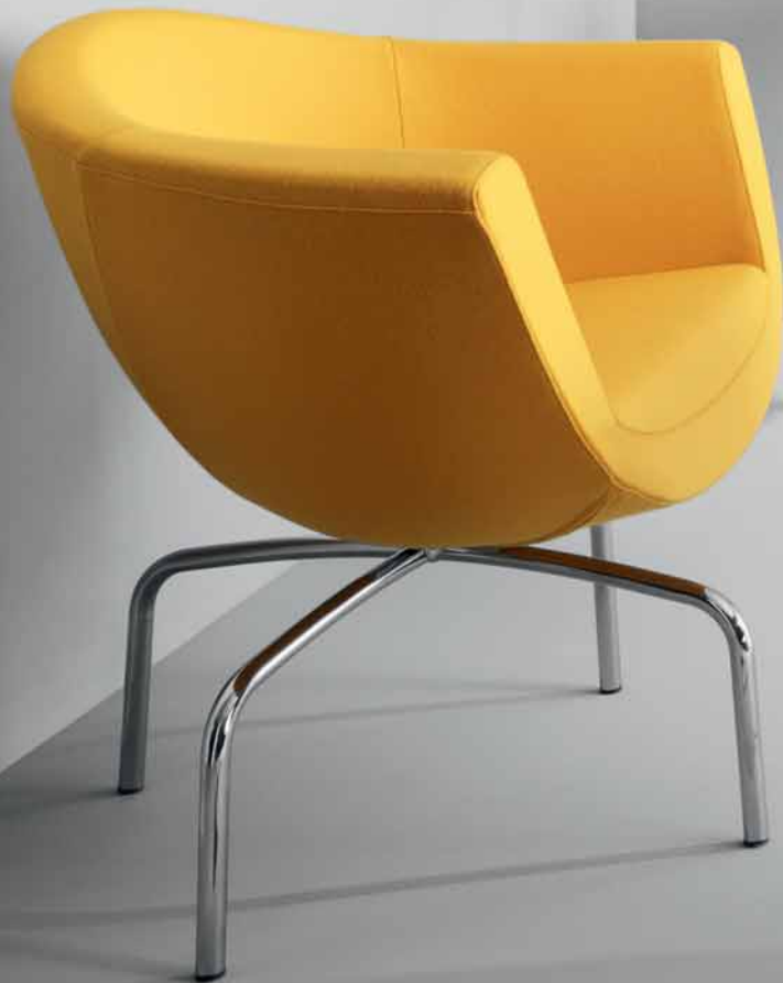
SORRISO 10HS CHROM