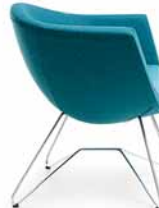
SORRISO 10V CHROM