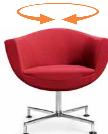
SORRISO 10F CHROM STOPKI